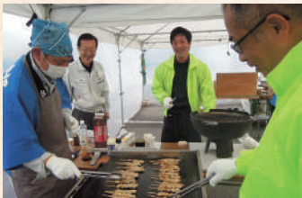
焼き鳥も大人気で完売でした