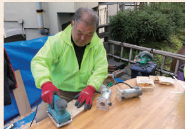
「木の名前ほり」も大盛況でした