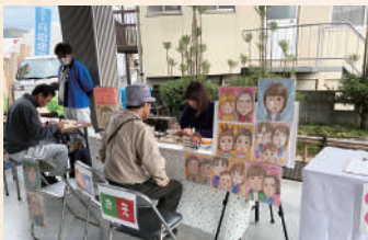
かわいい似顔絵も大人気でした