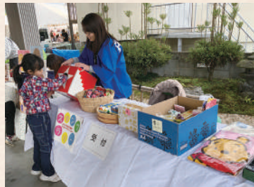
スタンプラリーで豪華景品をGET