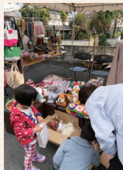
かわいい手作り手芸品