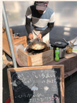
おいしい手打ち生パスタ